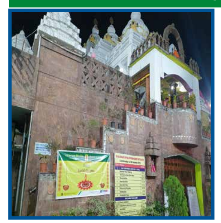
पुरी, ओडिशा में जगन्नाथ मंदिर